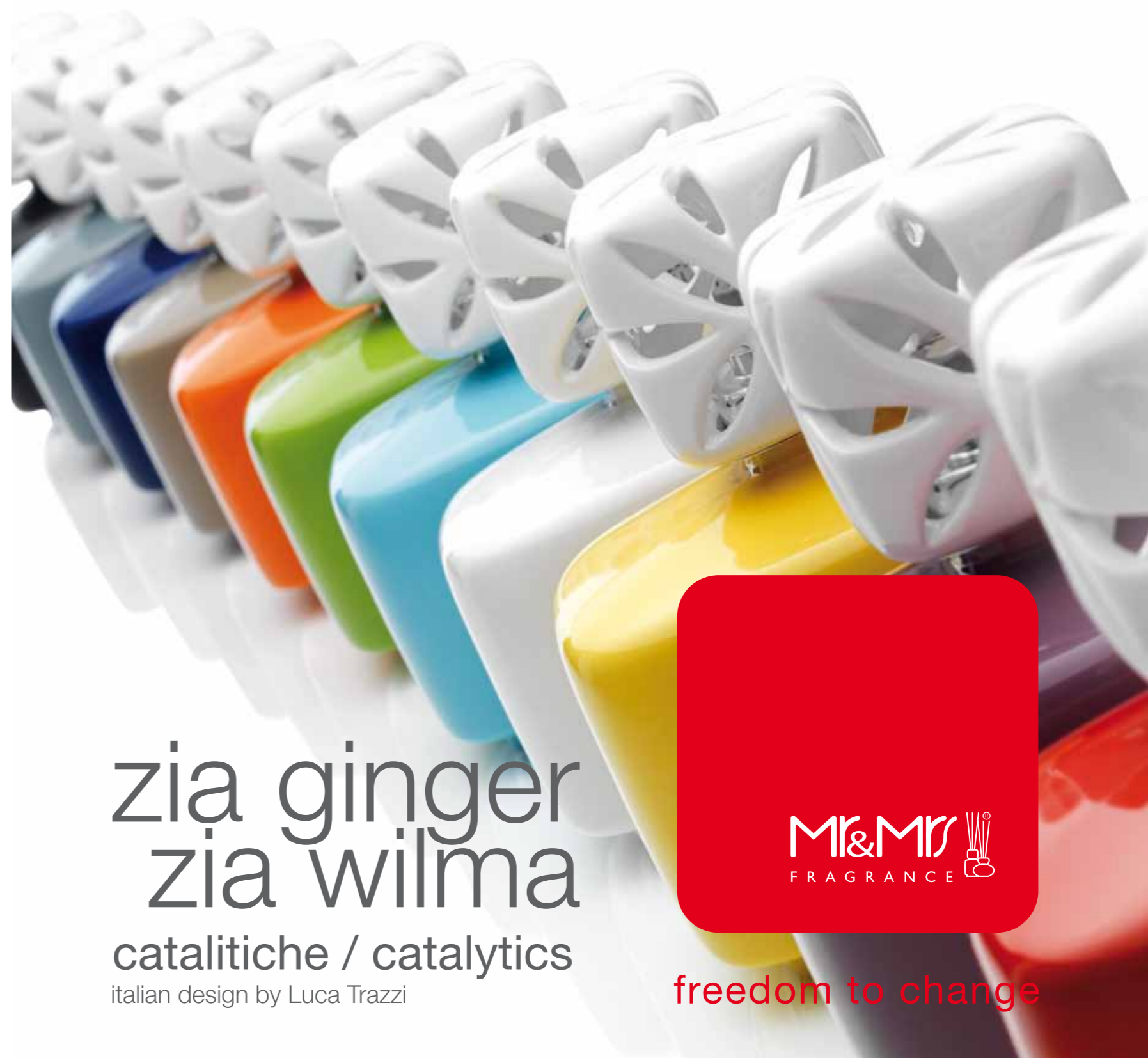
DIREZIONE DELLA COMUNICAZIONE: RAIMONDO SANDRI