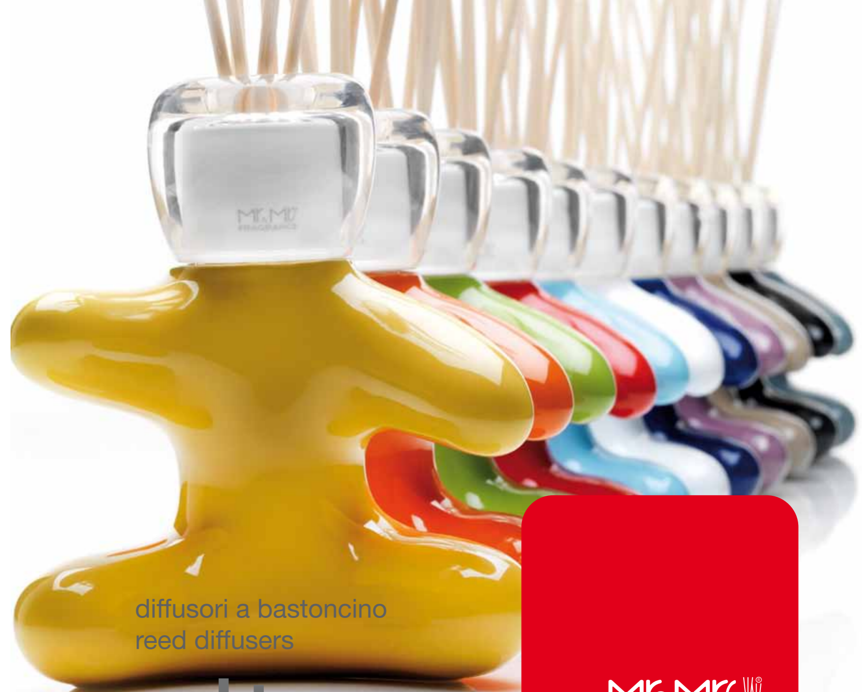
DIREZIONE DELLA COMUNICAZIONE: RAIMONDO SANDRI